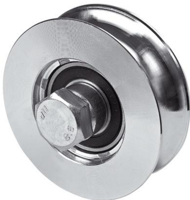
Фото Колесо с подшипником полукруглого сечения D-100 до 180 кг CAME 1700030

Отправьте запрос на коммерческое предложение и получите индивидуальные цены и сроки поставки