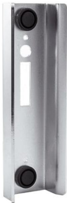
Фото Улавливатель для замка-крюка DOCK 52 CAME 1700055

Отправьте запрос на коммерческое предложение и получите индивидуальные цены и сроки поставки