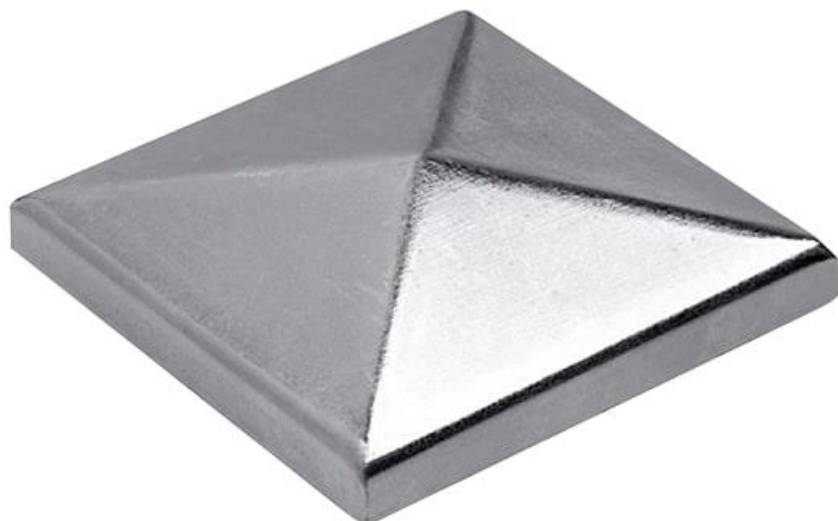
Фото Заглушка для столба квадратная ROOF 12 В САМЕ 1700065

Отправьте запрос на коммерческое предложение и получите индивидуальные цены и сроки поставки