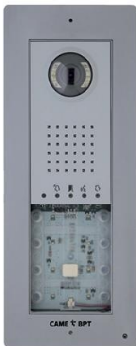
Фото Вызывная панель THANGRAM с цифровой видеокамерой, цвет серый (система new X1) CAME 62020010

Отправьте запрос на коммерческое предложение и получите индивидуальные цены и сроки поставки