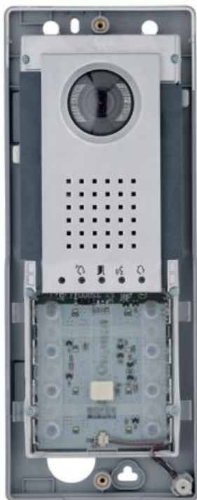
Фото Вызывная панель THANGRAM с цифровой видеокамерой, цвет металл (система new X1) CAME 62020020

Отправьте запрос на коммерческое предложение и получите индивидуальные цены и сроки поставки