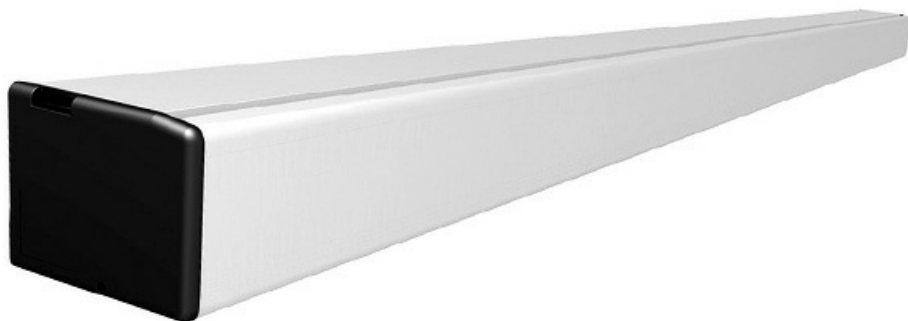
Фото FLUO-SLE STANDARD EMERGENCY, короб 2000 мм Автоматика для двустворчатой раздвижной двери, ширина прохода до 940 мм CAME 818SL-0030

Отправьте запрос на коммерческое предложение и получите индивидуальные цены и сроки поставки