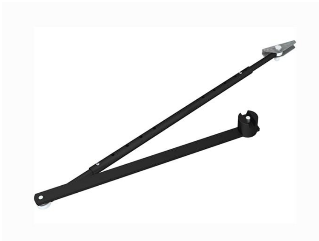
Фото Шарнирный рычаг для открывания створки наружу для серии FLUO-SW CAME 818XA-0041

Отправьте запрос на коммерческое предложение и получите индивидуальные цены и сроки поставки