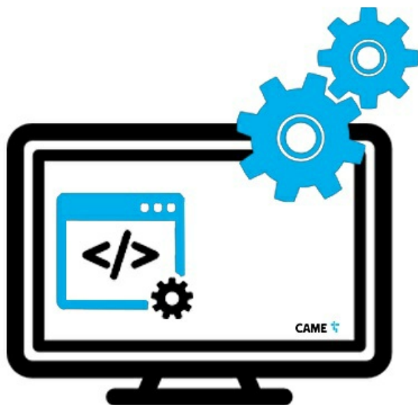
Фото ПО распознавания авто. номеров Автомаршал, интеграция с СААП «Vector_AP», скр. до 30 км/ч, 2 канала CAME AMGate-30-2RU

Отправьте запрос на коммерческое предложение и получите индивидуальные цены и сроки поставки