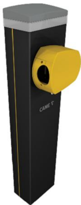
Фото Тумба шлагбаума из окрашенного алюминиевого сплава, класс защиты IP54 CAME 803BB-0070

Отправьте запрос на коммерческое предложение и получите индивидуальные цены и сроки поставки