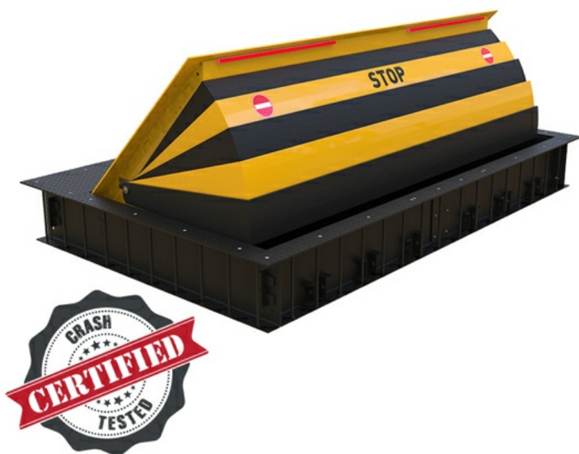
Фото Блокиратор дорожный HRB 900 SHALLOW CAME HRB-15P90-SHLW

Отправьте запрос на коммерческое предложение и получите индивидуальные цены и сроки поставки