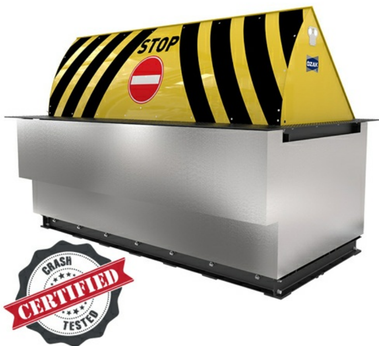
Фото Блокиратор дорожный серии HRB с двумя гидроцилиндрами CAME HRB-55R60-2p

Отправьте запрос на коммерческое предложение и получите индивидуальные цены и сроки поставки