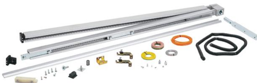
Фото Комплект "Антипаника" для раздвижных дверей MI6140 CAME 818XC-0025

Отправьте запрос на коммерческое предложение и получите индивидуальные цены и сроки поставки