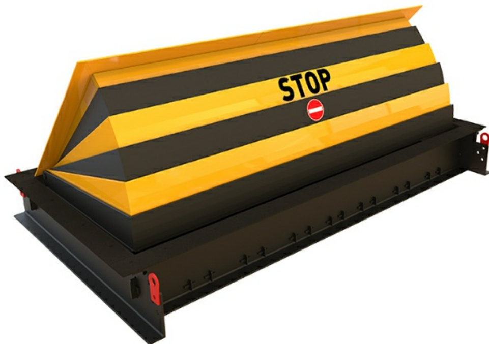
Фото Блокиратор дорожный RB 900 SHALLOW CAME RB-15P90-SHLW

Отправьте запрос на коммерческое предложение и получите индивидуальные цены и сроки поставки