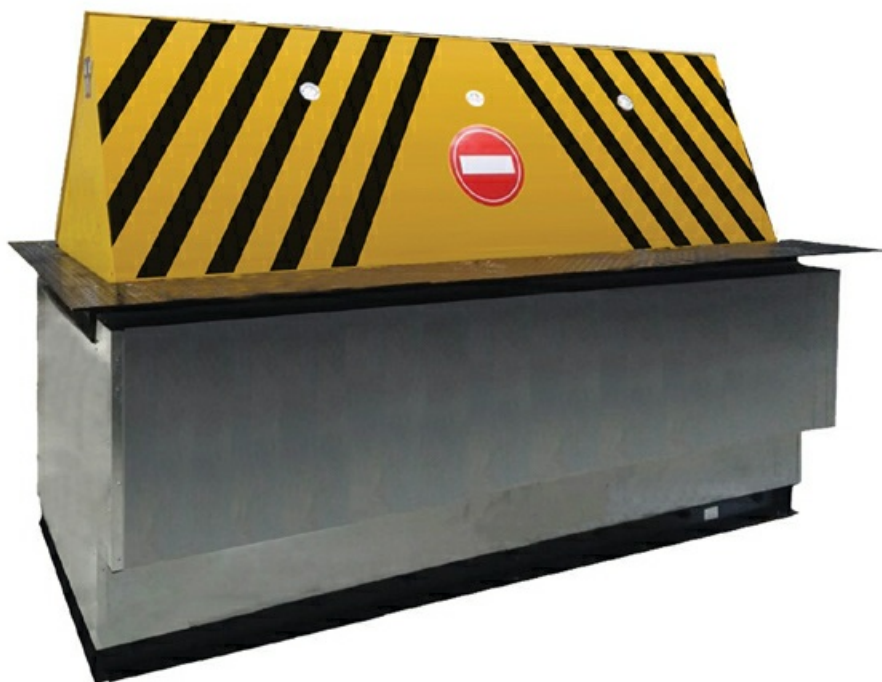
Фото Блокиратор дорожный RRB 900 Reinforced K8 усиленный CAME RRB-35F90-2p

Отправьте запрос на коммерческое предложение и получите индивидуальные цены и сроки поставки