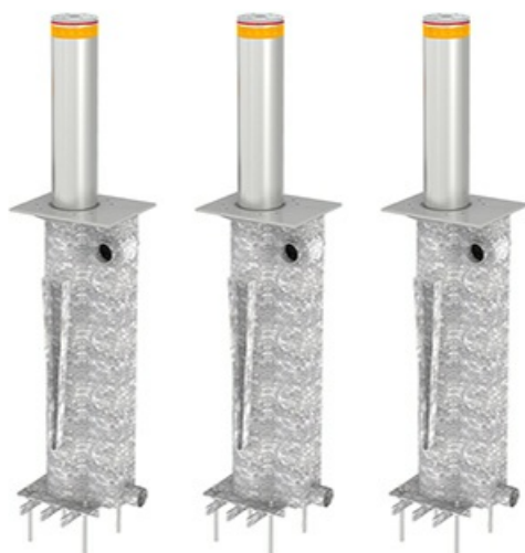
Фото Блокиратор автоматический выдвижной серии TBD Traffic Regulation CAME TBD-220H50-3

Тел: +7 499 681-75-28 | Email: sale@came-russia.ru | https://came-russia.ru