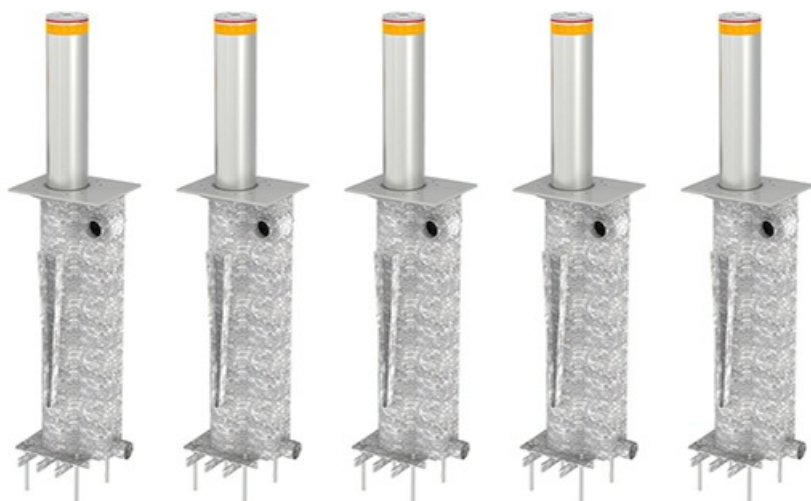
Фото Блокиратор автоматический выдвижной серии TBD 220 500 CAME TBD-220H50-5

Тел: +7 499 681-75-28 | Email: sale@came-russia.ru | https://came-russia.ru