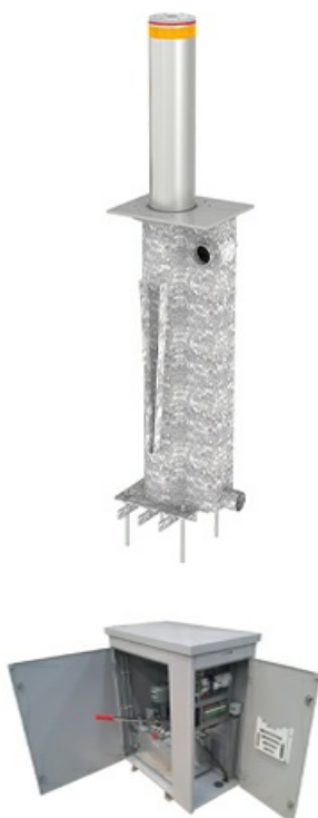
Фото Блокиратор автоматический выдвижной TBD 220H800 CAME TBD-220H80-1

Отправьте запрос на коммерческое предложение и получите индивидуальные цены и сроки поставки