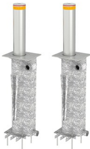
Фото Блокиратор автоматический выдвижной серии TBD 220H800 CAME TBD-220H80-2

Тел: +7 499 681-75-28 | Email: sale@came-russia.ru | https://came-russia.ru