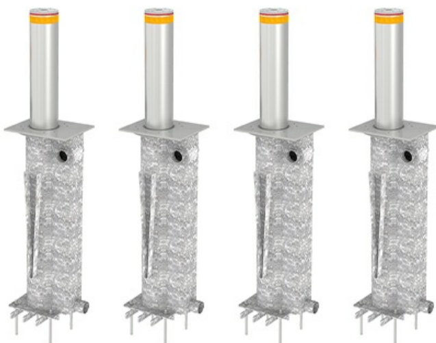
Фото Блокиратор автоматический выдвижной серии TBD 220 800 мм 4 болларда CAME TBD-220H80-4

Тел: +7 499 681-75-28 | Email: sale@came-russia.ru | https://came-russia.ru