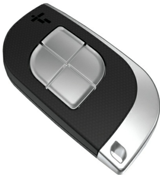
Фото Набор брелоков-передатчиков 5 шт. 4-х канальные с фиксированным кодом CAME TTS44FKS/5

Отправьте запрос на коммерческое предложение и получите индивидуальные цены и сроки поставки