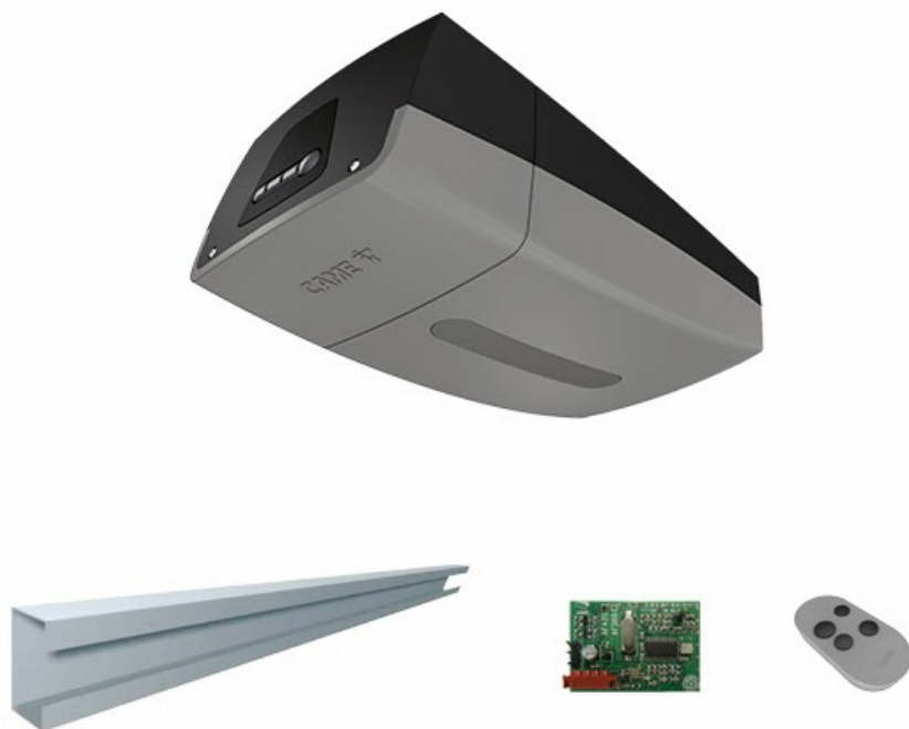
Фото Комплект автоматики для секционных ворот высотой до 2,2 м CAME VER06DES 2,2 COMBO KIT VER06DES 2,2 KIT

Отправьте запрос на коммерческое предложение и получите индивидуальные цены и сроки поставки