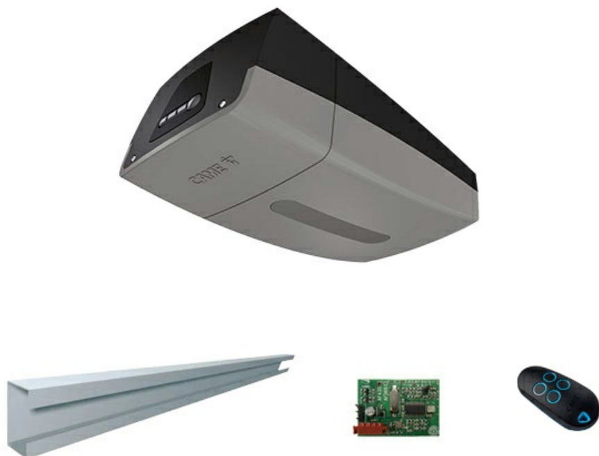
Фото Комплект автоматики для секционных ворот высотой до 3,2 м.(с радиоуправлением) CAME VER08DES 3,2 KIT

Отправьте запрос на коммерческое предложение и получите индивидуальные цены и сроки поставки